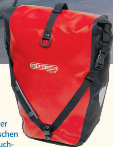
Ortlieb Backroller Classic Fahrradpacktasche

Egal ob gemächlich radeln oder schnell weiter. Unsere Packtaschen sind „schnell am Raddran und auch wieder unter Wasser dicht so wiesonur fliegen können senicht...“